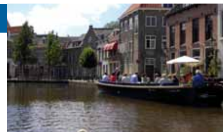
Oude Sluis en Zakkendragershuisje | Oude Sluis 15