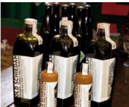
Jenevermuseum | Lange Haven 74

Schiedam is dé jeneverstad van Nederland. Daarom staat op een van de mooiste plekken, aan de Lange Haven, het Jenevermuseum. Een veelzijdig museum met vele mogelijkheden om een gezellige, smakelijke, maar ook leerzame invulling te geven aan uw middag, dag of avond. In de werkende branderij van het museum maakt de jeneverstoker de moutwijnjenever Old Schiedam, precies zoals 300 jaar geleden. De vaste presentatie van de collectie wordt jaarlijks aangevuld met tijdelijke tentoonstellingen. www.jenevermuseum.nl